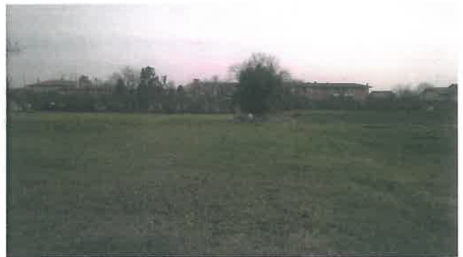
Cono di Visuale n.4