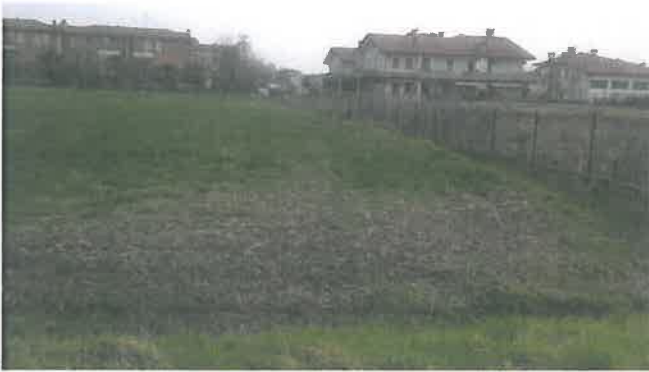
Cono di Visuale n.9