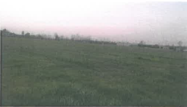
Cono di Visuale n.11