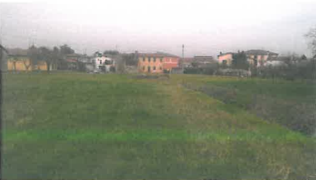
Cono di Visuale n.13