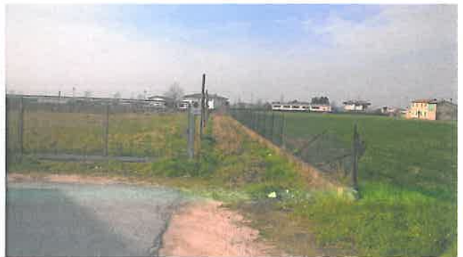
Cono di Visuale n.14