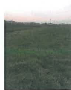
Cono di Visuale n.6