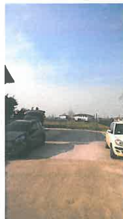
Cono di Visuale n.18