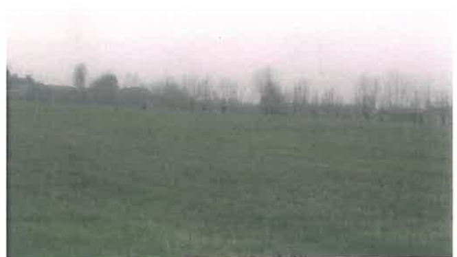
Cono di Visuale n.8