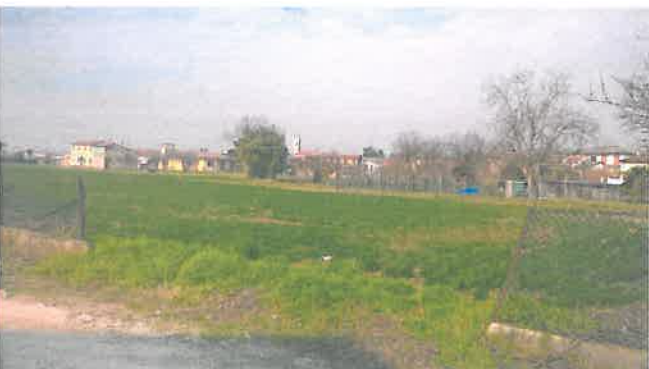
Cono di Visuale n.15