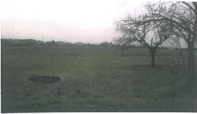
Cono di Visuale n.1