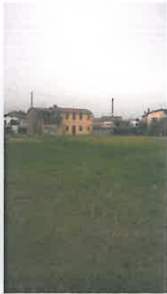
Cono di Visuale n.3