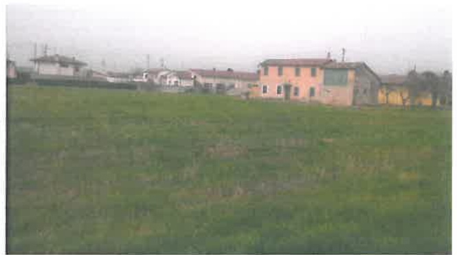
Cono di Visuale n.12