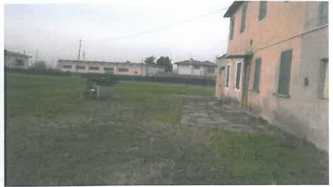
Cono di Visuale n.2