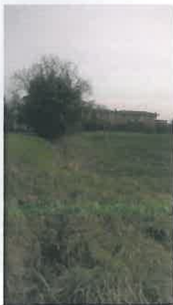
Cono di Visuale n.5