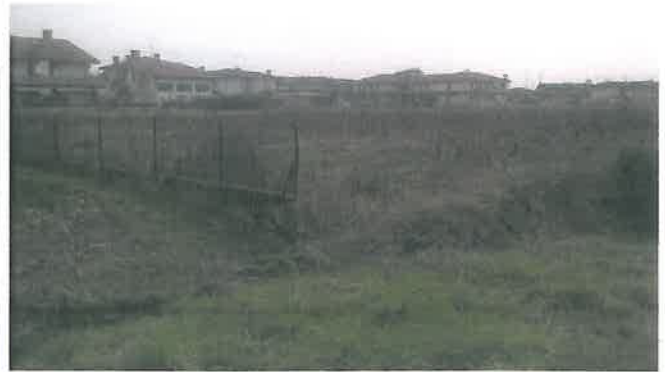
Cono di Visuale n.10