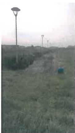
Cono di Visuale n.7