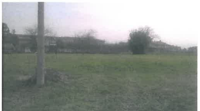
Cono di Visuale n.16