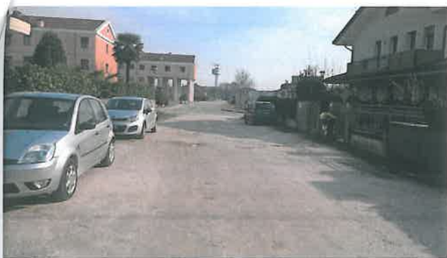
Cono di Visuale n.17